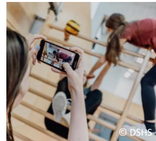
Abb. 2. Digitale Medien im Sportunterricht

Smartphones und Co. als Motivator Digitale Medien (z. B. Smartphones) können zu mehr Bewegung und Sport motivieren. 13 Inwieweit das auch für den Sportunterricht gilt, wurde bislang nur wenig erforscht. Wir konnten in einer Literaturübersicht mit 14 internationalen Studien zeigen, dass digitale Medien im Sportunterricht auf vielfältige Art und Weise eingesetzt werden (z. B. zur Übungsinstruktion, zum Videofeedback...) und die Motivation von Schüler:innen verbessern können. 14 Woran genau das liegt und wie es sich theoretisch erklären lässt, geht aus der aktuellen Studienlage noch nicht genau hervor und wird daher weiter erforscht.