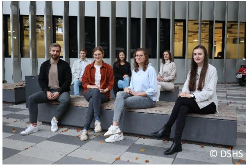
Abb. 4. Mitglieder des Graduiertenkollegs

Im Rahmen des Projekts Schulsport2030 wurde die Qualifizierung von Nachwuchswissenschaftler:innen gefördert. Die Nachwuchswissenschaftler:innen konnten während der Projektlaufzeit ihren in die Teilprojekte eingebetteten Qualifikationsvorhaben nachgehen und den Grundstein ihrer wissenschaftlichen Karriere legen. So wurden z. B. Forschungsvorhaben zur motivierenden Wirkung digitaler Medien im Sportunterricht oder zum Umgang mit Stress im Sportstudium bzw. der Berufspraxis von Sportlehrkräften vorangebracht. Mehr Informationen zu den Projekten der Nachwuchswissenschaftler:innen finden Sie hier .