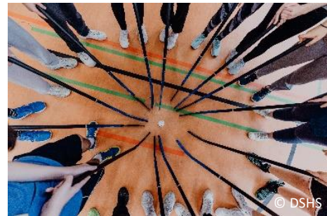
Abb. 1. Schüler:innen im Sportunterricht

Angehende Sportlehrkräfte umfassend vorbereiten Einstellungen von Lehrkräften werden hinsichtlich eines inklusiv ausgerichteten Unterrichtssettings als entscheidende Messgrößen für gelingende Inklusion gesehen. In einer Befragung von 196 angehenden Lehrkräften zeigen Ergebnisse, dass die Studierenden gegenüber dem Themenfeld Inklusion und Heterogenität eher positiv eingestellt sind. Einstellungen der Studierenden zur Dimension „Förderschwerpunkt“ fallen dabei allerdings neutral bis negativ aus. Die kritische Auseinandersetzung mit der eigenen Sichtweise auf Kinder und Jugendliche mit Förderbedarfen erscheint vor diesem Hintergrund zwingend 7 .