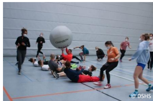
Abb. 5. Impressionen des 2. Kölner Tag des Schulsports im Jahr 2022

Der Kölner Tag des Schulsports fand 2018 zum ersten Mal statt. Über 300 Teilnehmer:innen nahmen an der Premiere zum Thema "Tägliche Herausforderungen meistern – Sportlehrkräfte im Fokus" teil und besuchten das aus einem Hauptvortrag, einer Postersession, 18 Workshops und vier Arbeitskreisen bestehende Programm. Auch beim zweiten Kölner Tag des Schulsports, der 2022 stattfand, nahmen über 200 Teilnehmer:innen teil. Das Angebot erstreckte sich über einen Hauptvortrag, 20 Workshops und drei Arbeitskreise zum Thema "Bewegung und Lernen im Schulsport – Heterogenität nutzen, Lernen unterstützen, Gesundheit fördern". Das Feedback der Teilnehmenden fiel durchweg positiv aus, sodass der Kölner Tag des Schulsports auch zukünftig als Austauschformat umgesetzt werden soll.