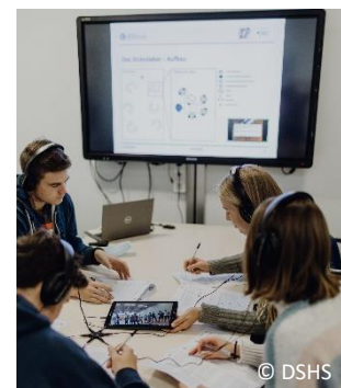
Abb. 3. Durchführung des Stresslabors

Im Stresslabor kann der Umgang mit Stress geübt werden Um (angehende) Sportlehrkräfte auf den Umgang mit Stress in Unterrichtssituationen gezielt vorzubereiten, wurden in unserem Projekt unterschiedliche Lehr-/Lernwerkzeuge entwickelt. Ein besonderes Lehr-/Lernwerkzeug ist das Stresslabor 21 , in dem angehende Sportlehrkräfte videogestützt mit realen Unterrichtssituationen konfrontiert werden, die potentiell stressreich sind (z. B. Konflikte mit Schüler:innen). Anhand dieser Situationen bekommen die angehenden Sportlehrkräfte die Möglichkeit zu üben, ihre eigene Stressreaktion in diesen Situationen wahrzunehmen, und erproben verschiedene Möglichkeiten der Stressreduktion. Evaluationsstudien belegen die Wirksamkeit und Akzeptanz des Stresslabors durch die Teilnehmenden.