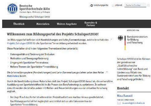
Abb. 6. Startseite des Bildungsportals

Die im Projekt Schulsport2030 entwickelten Lehr-/Lernwerkzeuge basieren auf aktuellen wissenschaftlichen Erkenntnissen, die für die Praxis der (universitären) Sportlehrkräftebildung aufbereitet wurden. Damit die Ergebnisse langfristig und möglichst niederschwellig verfügbar sind, wurde das "Bildungsportal Schulsport2030" entwickelt. Damit nimmt das "Bildungsportal Schulsport2030" eine Vermittlerrolle zwischen der Lehrkräftebildungsforschung und der Praxis der (universitären) Sportlehrkräftebildung ein.