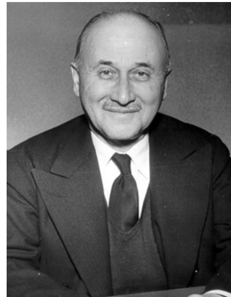
Deutschen Olympischen Sportbundes

Die Sportförderung des