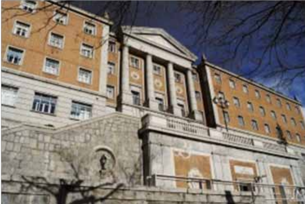
Der Campus der San Pablo CEU Universität Madrid war Gastgeber der Konferenz.

Titel „ Party-orientation, national interest or epistemic community – what drives sports policies of the European Parliament? “.