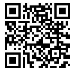
Abb. 7. Zugang zum Bildungsportal

Im "Bildungsportal Schulsport2030" befinden sich mehr als 100 Lehr-/Lernwerkzeuge, die in den Schulsport2030-Teilprojekten „Umgang mit Heterogenität und Förderung von Inklusion“, „Motivation und Bewegungsförderung“ und „Umgang mit Sportlehrer:innenstress“ entwickelt wurden. Bei der Suche nach Lehr-/Lernwerkzeugen hilft eine Such- und Filterfunktion mit der systematisch nach den Schulsport2030-Themenbereichen, nach dem Format (z. B. Arbeitsblatt, Video) und nach dem Anwendungskontext (z. B. Sportunterricht, Fort- und Weiterbildung) recherchiert werden kann.