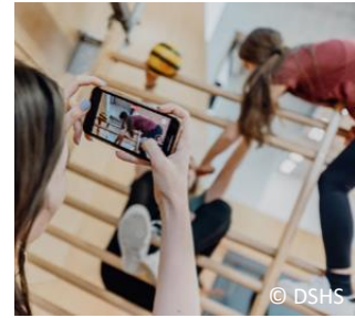
Abb. 2. Digitale Medien im Sportunterricht

Smartphones und Co. als Motivator Digitale Medien (z. B. Smartphones) können zu mehr Bewegung und Sport motivieren. 13 Inwieweit das auch für den Sportunterricht gilt, wurde bislang nur wenig erforscht. Wir konnten in einer Literaturübersicht mit 14 internationalen Studien zeigen, dass digitale Medien im Sportunterricht auf vielfältige Art und Weise eingesetzt werden (z. B. zur Übungsinstruktion, zum Videofeedback...) und die Motivation von Schüler:innen verbessern können. 14 Woran genau das liegt und wie es sich theoretisch erklären lässt, geht aus der aktuellen Studienlage noch nicht genau hervor und wird daher weiter erforscht.