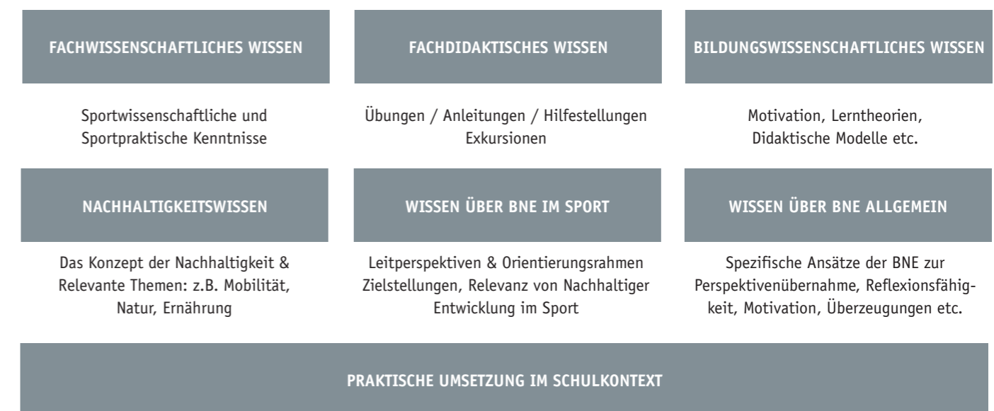
Abb. 1: Verschiedene Wissensbereiche im Zusammenhang mit BNE im Sport