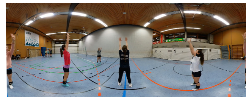
Abb. 1: Screenshot aus der Videoaufnahme zum oberen Zuspiel ohne Ball aus der explorativen Umsetzung dieses Konzepts, dargestellt in der Panoramaansicht zur Veranschaulichung der multiperspektivischen Sichtweise der 360°-Videos

Das Konzept sieht daher eine Verbindung von Theorie und Praxis vor. Die Technik wird nicht nur selbst praktisch erlernt oder verbessert, sondern auch theoriebasiert genauer analysiert. Mithilfe der 360°-Videos soll eine Bewegungsanalyse im Hinblick auf die Theorie durchgeführt und die einzelnen Bewegungsphasen beschrieben werden. Dabei teilen die Lernenden die Bewegung in die Bewegungsabschnitte ein und nehmen innerhalb dieser eine Bewegungsbeschreibung vor. Für das obere Zuspiel wurden zu Beginn in Kapitel 2 die entsprechenden Bewegungsabschnitte „Hel-, sin-, ki“ beschrieben. Insgesamt sollen die 360°-Videos in dieser Lerneinheit zum Bewegungserlernen, zur Bewegungsreflexion und zur Bewegungsbeschreibung eingesetzt werden. Dabei soll mithilfe der 360°-Videos keine Expertenmodellierung und damit keine optimale Technikausführung angestrebt werden. Es geht hauptsächlich darum, die Bewegungsausführung mit einem minimalen Aufwand aus unterschiedlichen Perspektiven zu visualisieren, die Bewegung zu demonstrieren und zu analysieren.