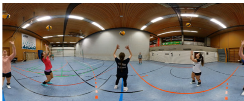
Abb. 3: Screenshot aus der Videoaufnahme zum oberen Zuspiel mit Ball und eigenem Anwurf aus der explorativen Umsetzung dieses Konzepts, dargestellt in der Panoramaansicht zur Veranschaulichung der multiperspektivischen Sichtweise der 360°-Videos

Insgesamt umfasst das Konzept somit die in Tabelle 1 dargestellten zwei 360°-Videos. Dabei soll das 360°-Video ohne Ball (siehe Abb. 1) dazu dienen, die Bewegung und die einzelnen Phasen detailliert betrachten und analysieren zu können. Hierbei geht es darum, die Phasen zu erkennen und die Bewegung zunächst isoliert ohne Ball zu betrachten. Dabei soll der grobe Bewegungsablauf visualisiert werden, ohne dass beispielsweise der Ball von den Hauptaspekten der Bewegungsausführung ablenkt. Auch kann anhand dieses Videos der Bewegungsablauf ortsunabhängig und ohne Ball vor dem praktischen Training nachvollzogen und imitiert werden. Das 360°-Video mit Ball (siehe Abb. 3) soll dann eine Übertragung auf die Spielsituation und die konkrete Ausführung mit Ball darstellen. Hier wird der Treffpunkt des Balles sichtbar und die Phasen und deren spielnahe Anwendung werden erkennbar.